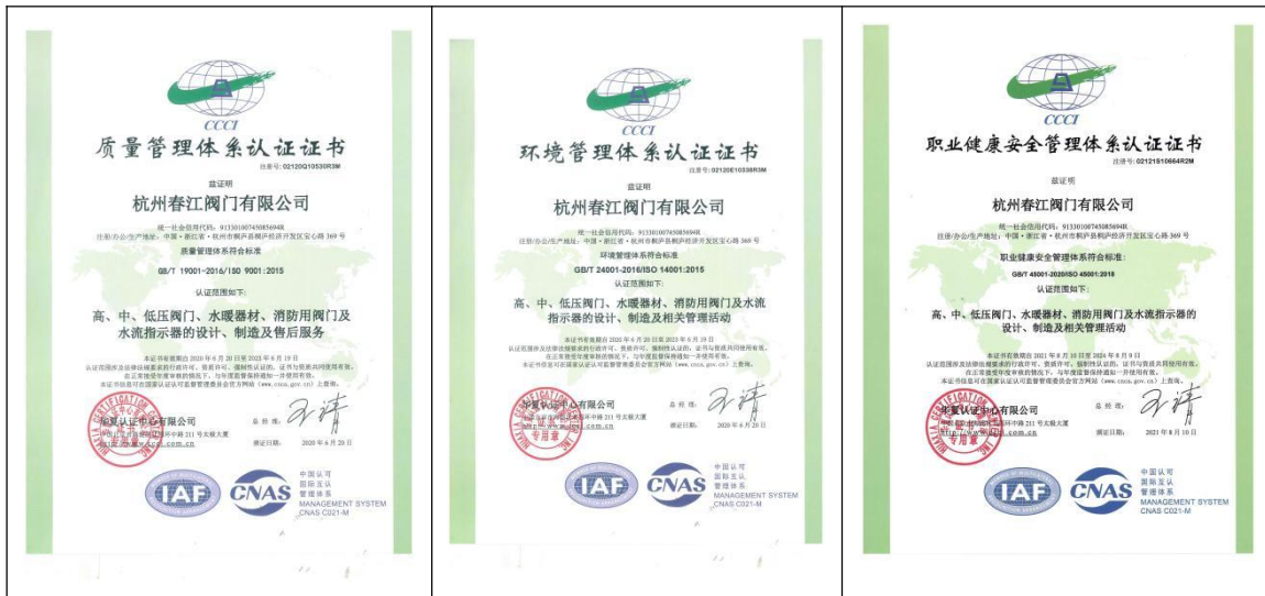
质量管理体系认证